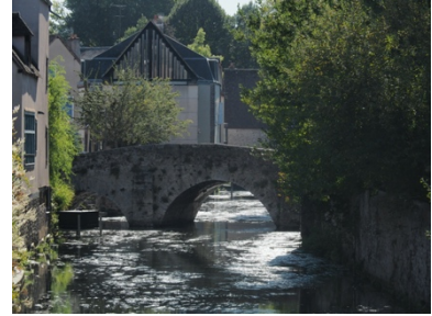
Der Fluss Eure