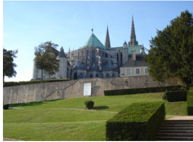
Blick auf die Sakristei